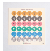
⑥センサリーマップステッカー