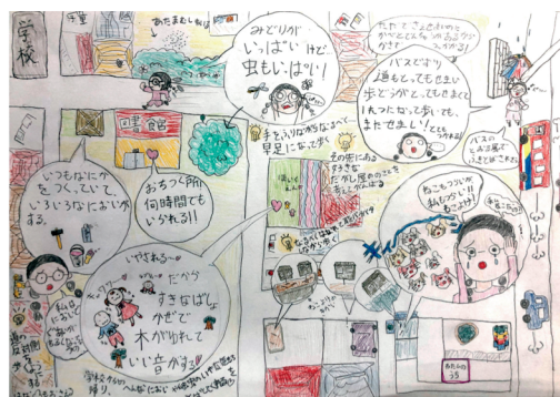
センサーマップコンテスト2022 小学生部門 最優秀賞作品